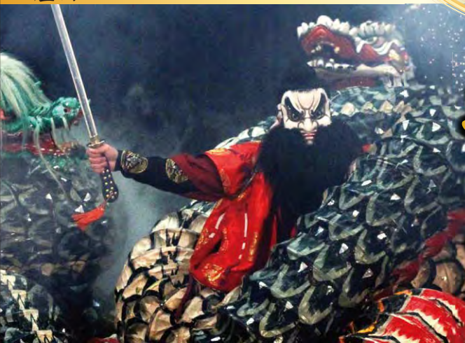
八岐大蛇(中国・四国地方)