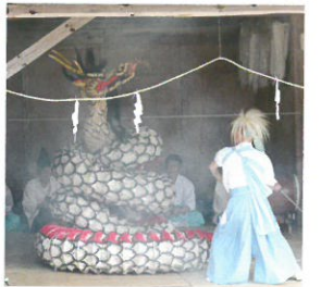
「清めの舞、悪魔祓い、蛇捕り」 大和町大具神楽保存会(三原市)