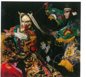
「滝夜叉姫」春木神楽団(北広島町)