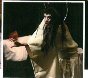
「滝夜叉姫」大森神楽団(広島市)