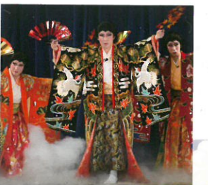
「紅葉狩」八千代神楽団(安芸高田市)