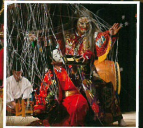
「羅生門」堀神楽団(安芸太田町)